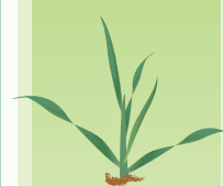
début tallage à épi 1 cm