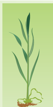
mi-tallage à ligule juste visible