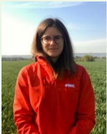
C. Brémard CRC Nord

Nouvelles levées : fumeterre, matricaire, pensée des champs, renouée des oiseaux, véronique FDL, plantin, stellaire, trèfle et séneçon.