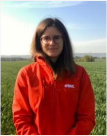
C. Brémard CRC Nord

Nous reconduisons, au travers du réseau Obsherb, le suivi des levées de chardons. Depuis le dernier bulletin, nous observons des levées de chardons très dynamiques dans les parcelles du réseau. Le chardon est la 1 ère adventice observée dans les parcelles, suivi du gaillet, de la renouée liseron et de la matricaire.